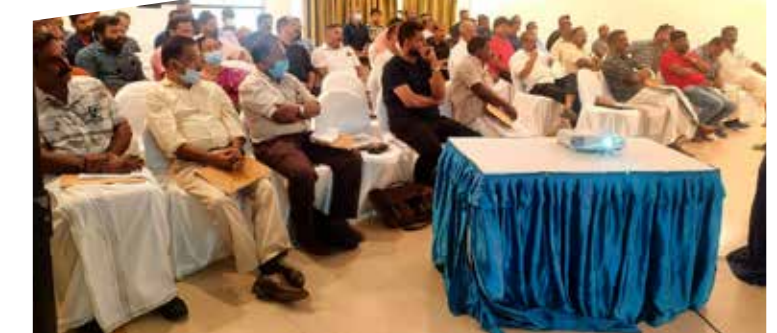
എൻ.ബി.എഫ് സി.യുടെ നേതൃത്വത്തിൽ നടത്തുന്ന സംരംഭകത്വ പരിശീലനപരിപാടികളിൽ നിന്നും..