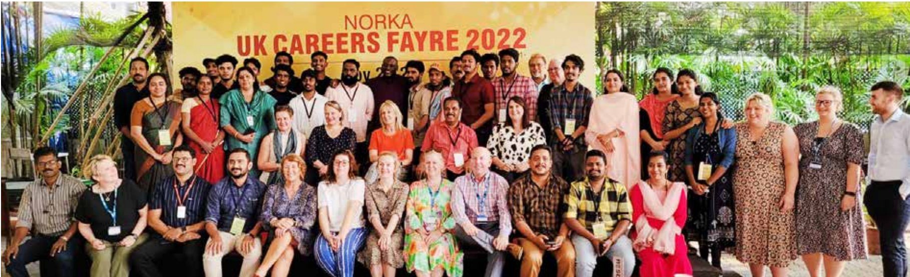
2022 നവംബറിൽ കൊച്ചിയിൽ നടന്ന നോർക്ക - യു.കെ കരിയർ ഫെയറിന് നേതൃത്വം നൽകിയ സംഘാംഗങ്ങൾ ...